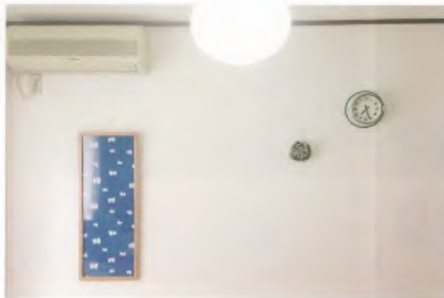
客廳牆壁。這裡也裝飾著「mina perhonen」的手巾。掛上設計簡單的時鐘，營造出既可愛，又充滿禪意庭院風格的空間意象。