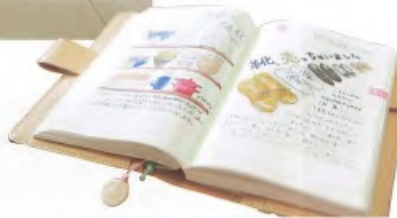
在「HOBO 手帳」繪製斷捨離的圖畫日記，上傳至部落格。無論是配色或精心的構圖，令人愈看愈有趣。