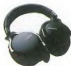
⑧ Sony MDR-IADAC 伊藤最滿意的頭戴式耳機。可直接將數位訊號轉換成數據，收聽高解析音樂，音質更清晰。