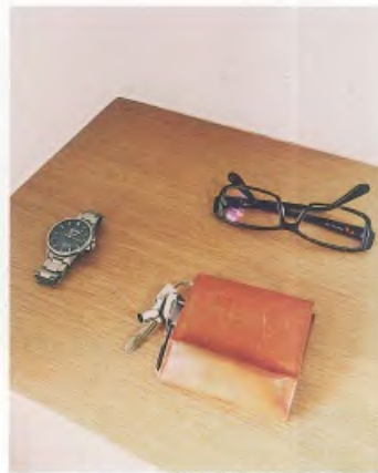
abrasus 的輕薄錢包上，掛著家裡與自行車鑰匙。這張照片是用 iPhone 拍的，出門前將手機放進口袋，雙手空空地四處亂碰。