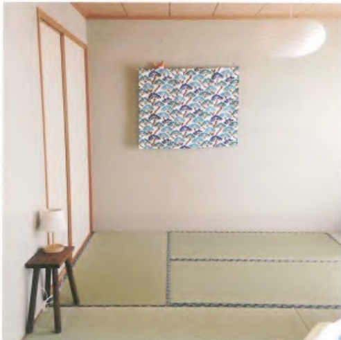
整潔清爽的和室也掛上「sou・sou」的手作掛軸裝飾。雖是租來的房子，也要營造自家空間、障地的感覺。