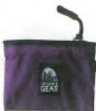
③ Granite Gear隨身包 Granite Gear 的登山隨身包。輕盈耐用的尼龍布料，可拿來放次要的隨身物品。