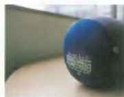
④ mont-bell睡袋 遇到陡峭嚴寒、不適合架設吊床的地區，就可使用睡袋。型號是「Down Hugger 800 # 3」。