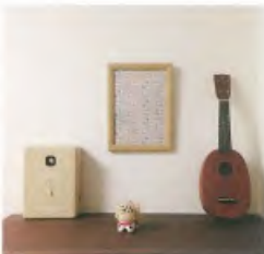
精選朋友送的禮物，精心擺放。鴿子時鐘、小狗擺件與烏克麗麗。不多也不少，營造巧妙的平衡感。