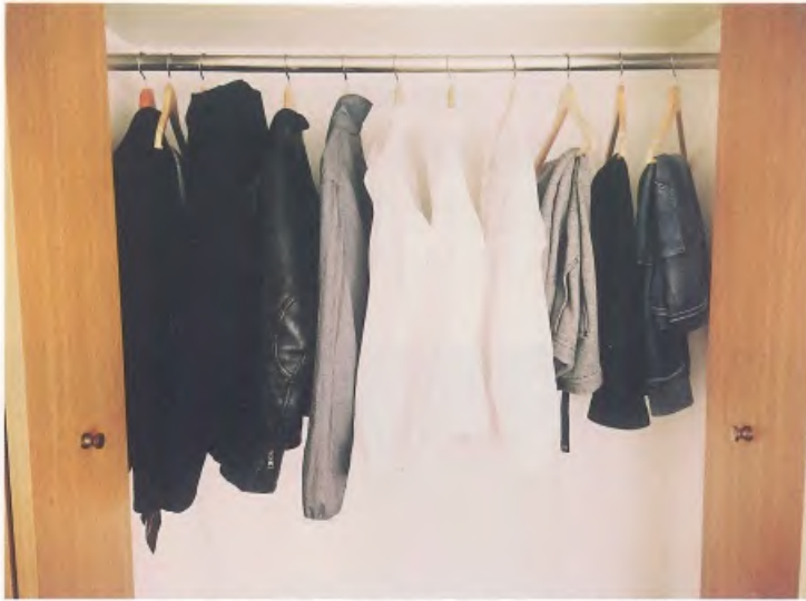
我的衣櫥。從羽絨外套到西裝一應俱全，以白襯衫為主，我希望能打造接近賈伯斯那種「個人制服」感的造型風格。